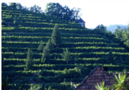
Für Vintra öffnen Weinakademiker die Türen zu Weingütern der Wachau. Link zum Download am Textende!

Arrangements nach Maß und zum Wunschtermin